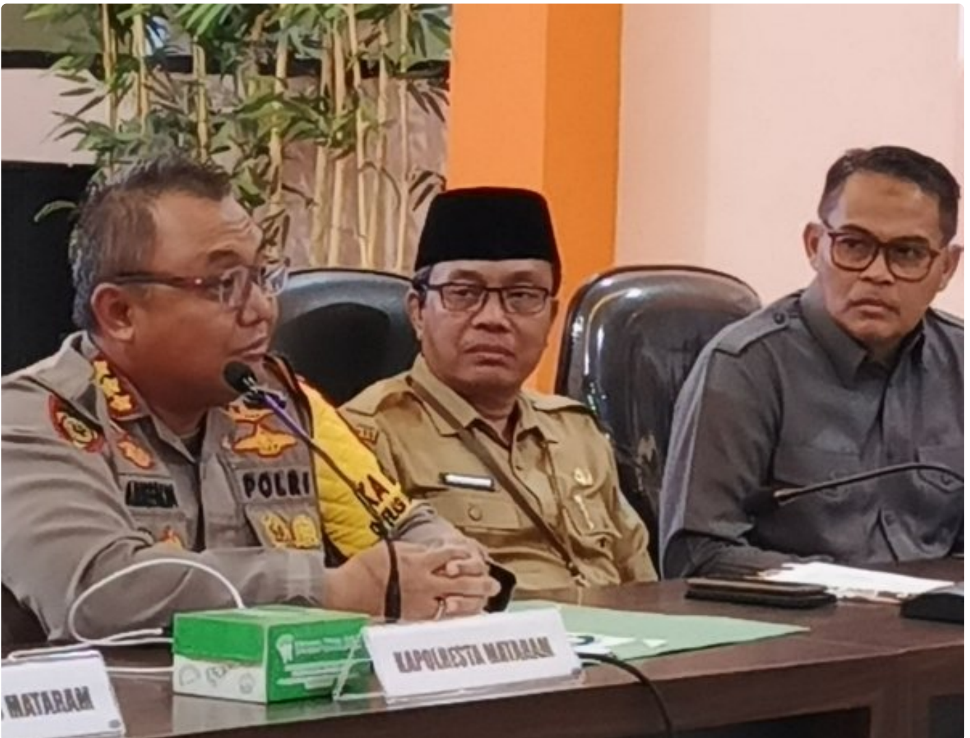
Kapolresta Mataram (Kiri) saat memimpin Konferensi pers akhir tahun, Selagi (31/12/2024)

MATARAM, NTB – Polresta Mataram mengakhiri tahun 2024 dengan menggelar Konferensi Pers Akhir Tahun, sebuah forum transparansi untuk memaparkan capaian dan inovasi yang telah dilakukan selama satu tahun. Kegiatan yang